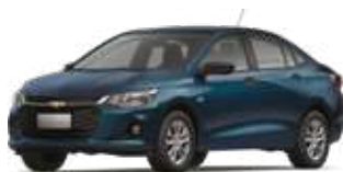
Қою көк / Темно-синий