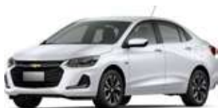
Ақ / Белый

Цветовая гамма Chevrolet Onix состоит из шести вариантов: Традиционные – белый, черный, серебристый, темно-серый, яркие – темно-синий и красный. Длина составляет 4 474 мм, ширина – 1 730 мм. Колесная база – 2 600 мм, а клиренс, по данным производителя, – 136 мм. Объем топливного бака – 44 л.