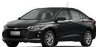
Қара / Черный