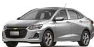
Күміс / Серебристый