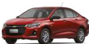
Қызыл / Красный