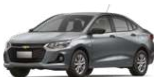
Қою сұр / Темно-серый